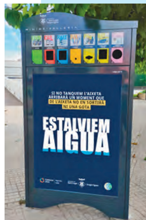
A la imatge la campanya que vam fer a la minideixalleria el 2022

Si no hi ha un canvi significatiu a curt plaç, si volem obrir l'aixeta i que ragi aigua, caldrà que tothom hi col·labori.