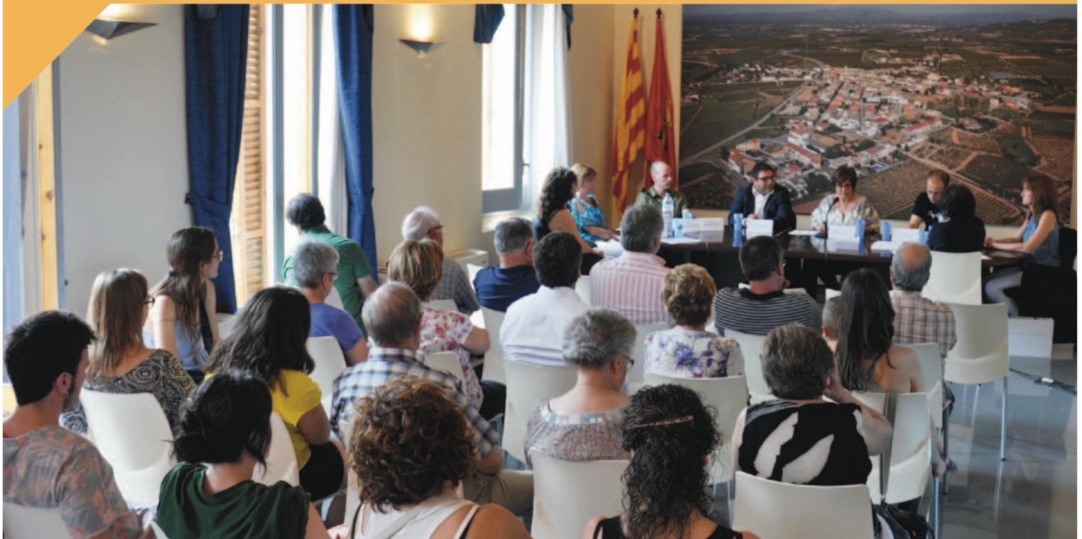
Ple de la Constitució de l'actual Legislatura

Voleu rebre el Mentrestant en color per mail? Demaneu-lo a: santcugatsesgarrigues@esquerra.org